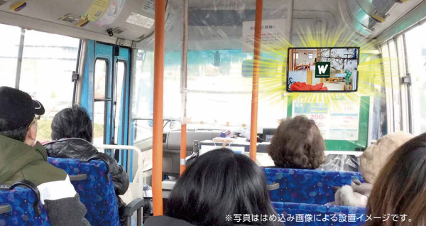
※写真ははめ込み画像による設置イメージです。