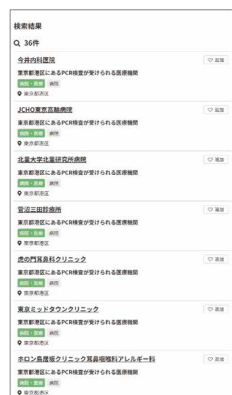
▲都道府県ごとの検索 画面例