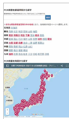
▲地図から探す 画面例