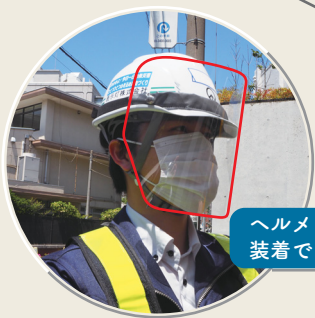
ヘルメットに装着できます