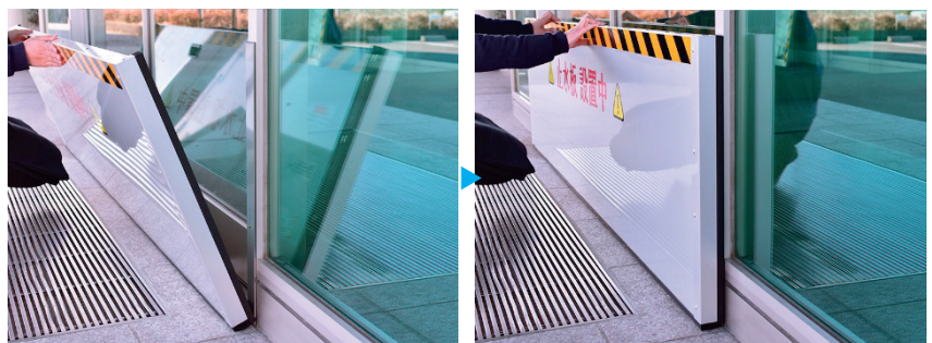
いざという時に、予め設置してある磁性板にワンタッチで装着が可能です！